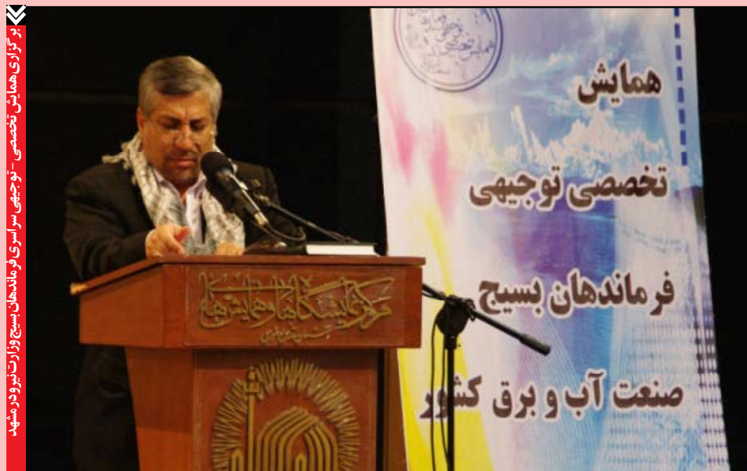
برگزاری همایش تخصصی - توجیهی سراسری فرماندهان بسیج وزارت نیرو در مشهد