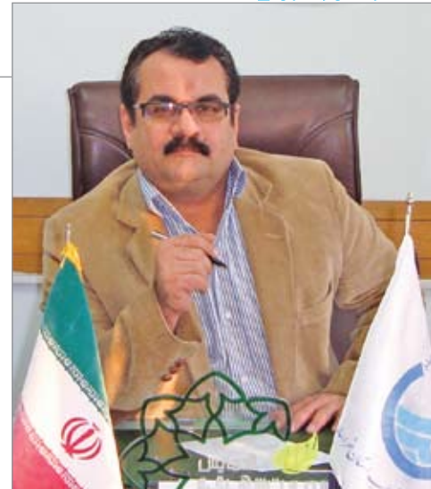
مدیر امور آب و فاضلاب درگز: