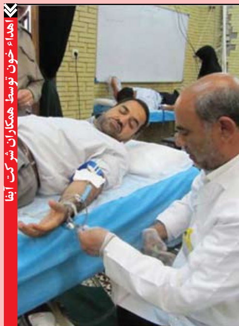
اهداء خون توسط همکاران شرکت آبفا