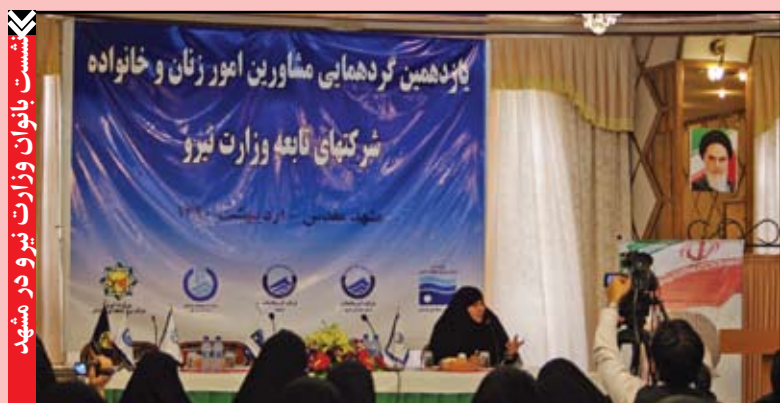
نشست بانوان وزارت نیرو در مشهد