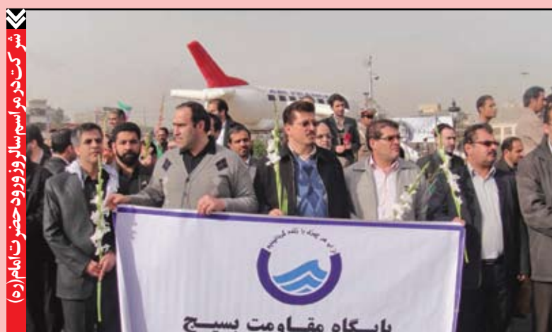
شرکت در مراسم سالروز ورود حضرت امام (ره)