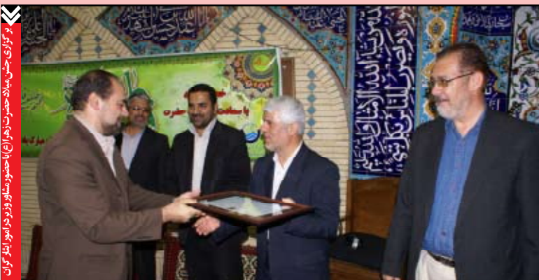
برگزاری جشن میلاد حضرت زهرا (ع) با حضور مشاور و رؤسای امور و مدیران