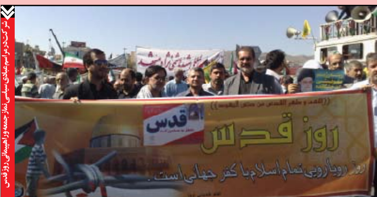
شرکت در مراسم جهانی سلسلی نماز جمعه و راهپیمایی روز قدس