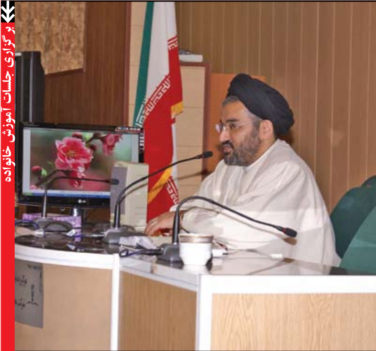
برگزاری جلسات آموزش خانواده