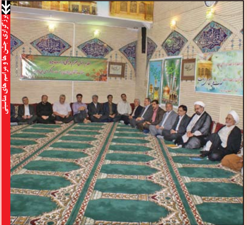
برگزاری جشن ها و مراسم های مناسبتی