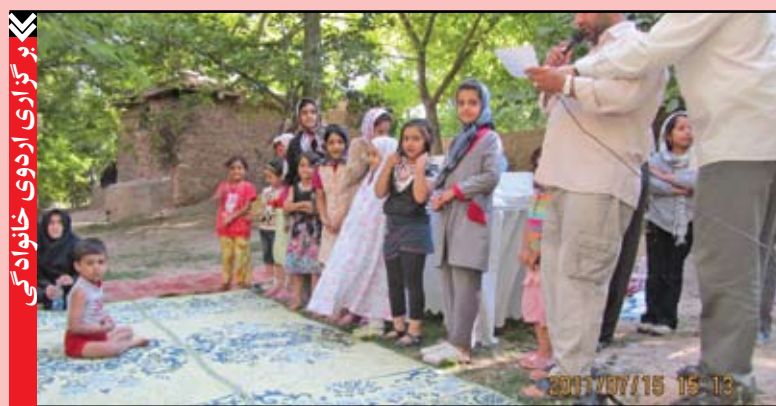
برگزاری اردوی خانوادگی