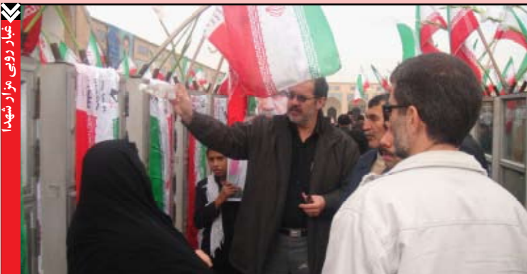
عباد رویی مزار شهدا