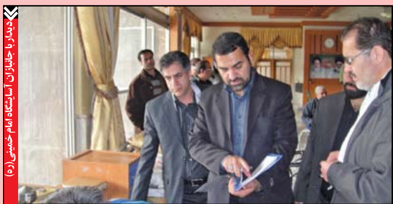
دیدار با جایزبان آسایشگاه امام خمینی (ره)