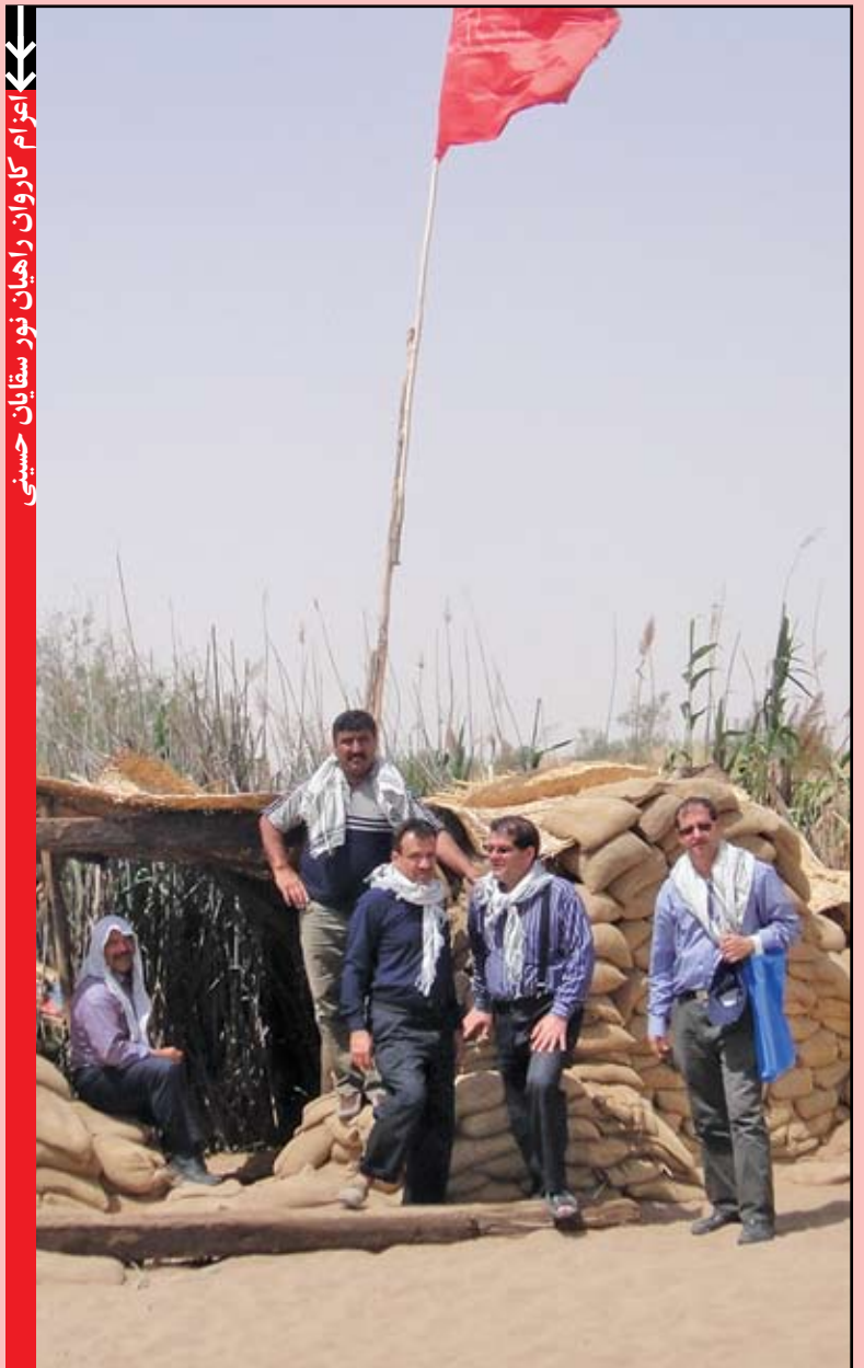
اعزام کاروان راهیان نور سقاییان حسینی